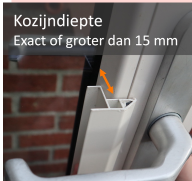
Kozijndiepte Exact of groter dan 15 mm

Er zijn twee type passtukken voor de Splendid Pliss, Day'n Night, Latende en het Rolgordijn. Welke je moet gebruiken hangt af van de diepte van je kozijn waarop je je systeem wilt monteren.