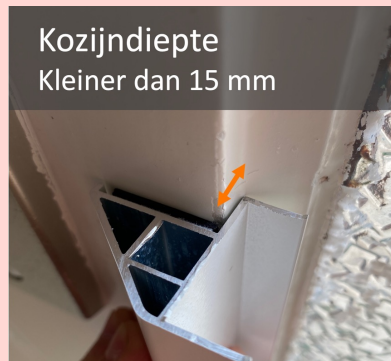
Kozijndiepte Kleiner dan 15 mm